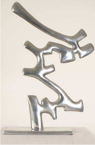
Etienne Hajdu, Courbe et contrecourbe , 1971