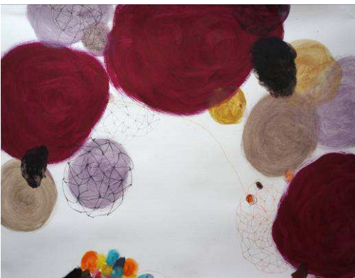
Saraswati Gramich, Agglomération V , 2013 © Laurence Godart