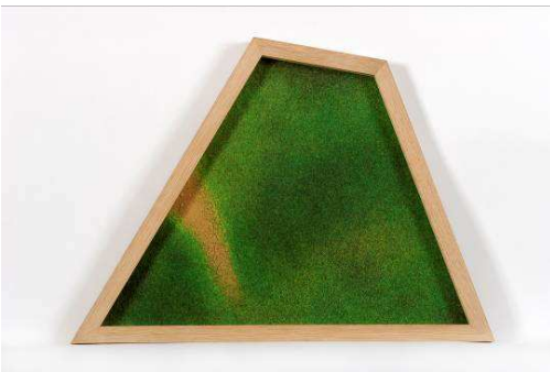
Guillaume Liffra, Sans titre , 2010