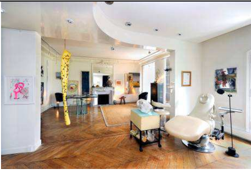
Collection Philippe Delaunay © Laurence Godart