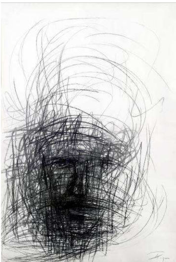
Agnès Pezeu, Sans titre , 2011