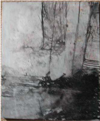
Colette Brunschwig, Sans titre , 1977