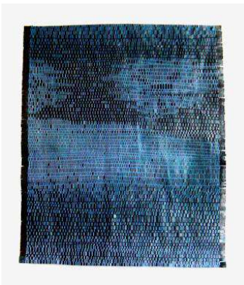
Carmen Charpin, Bleu Nocturne , 2007