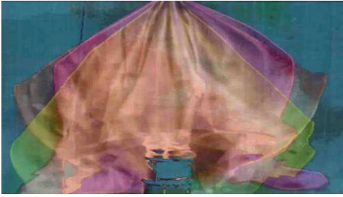
Etienne Zucker, Loïefuller , 2014 (vidéo)