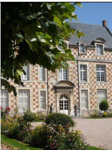
Musée des Beaux-Arts de Bernay Façade sur jardin