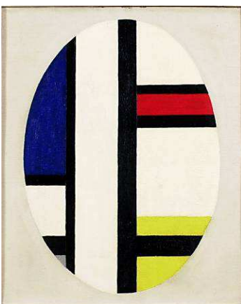
Jean Gorin, Composition n° 18 , 1944